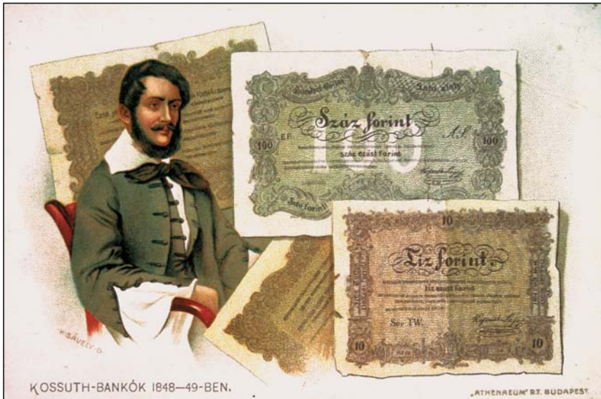
Кошут и первые банкноты периода венгерской автономии

После роспуска Государственного собрания Кошут начал публиковать «Известия законодательного органа», в которых подписчикам сообщалось о том, что происходило на заседаниях местной администрации различных комитатов. На страницах этой газеты, выглядевшей как рукопись, рассказывалось о протестах оппозиции по поводу судебных процессов, возбужденных против видных представителей этой оппозиции в Государственном собрании созыва 1832–1836 годов. Правящая верхушка этого вынести уже не могла. Сначала Кошута призвали покончить с такого рода деятельностью, затем приняли решение о возбуждении судебного процесса против него с обвинением в оскорблении Его Величества. 5 мая 1837 года он был арестован, а затем приговорен к четырем годам тюремного заключения.