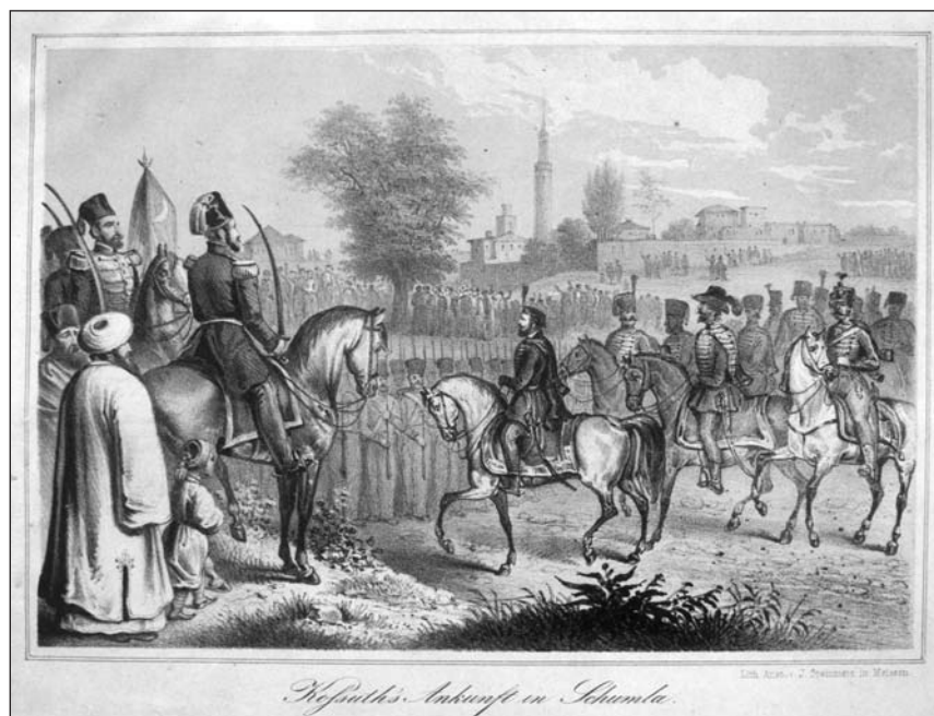
Kossuth's Ankunft in Schumla.