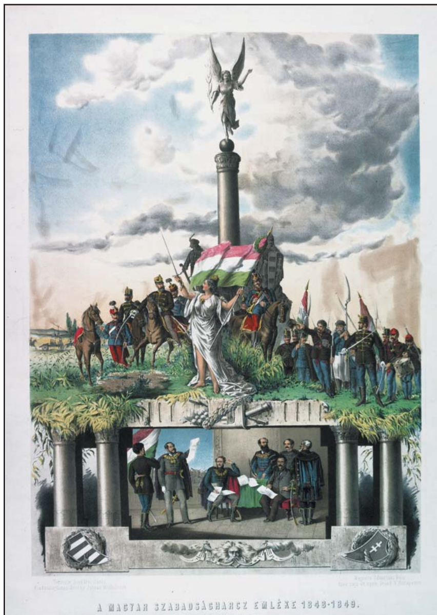
Аллегорическое изображение венгерской революции и национально-освободительной борьбы 1848–1849 годов. Внизу – Шандор Петёфи, Лайош Кошут, Иштван Сечени, Лайош Баттяни, Ференц Деак, Янош Есенек и Жигмонд Перени

Уроки жизненного пути и творческой деятельности Кошута неисчислимы. Это был истинный общественно-политический деятель универсального масштаба, которого