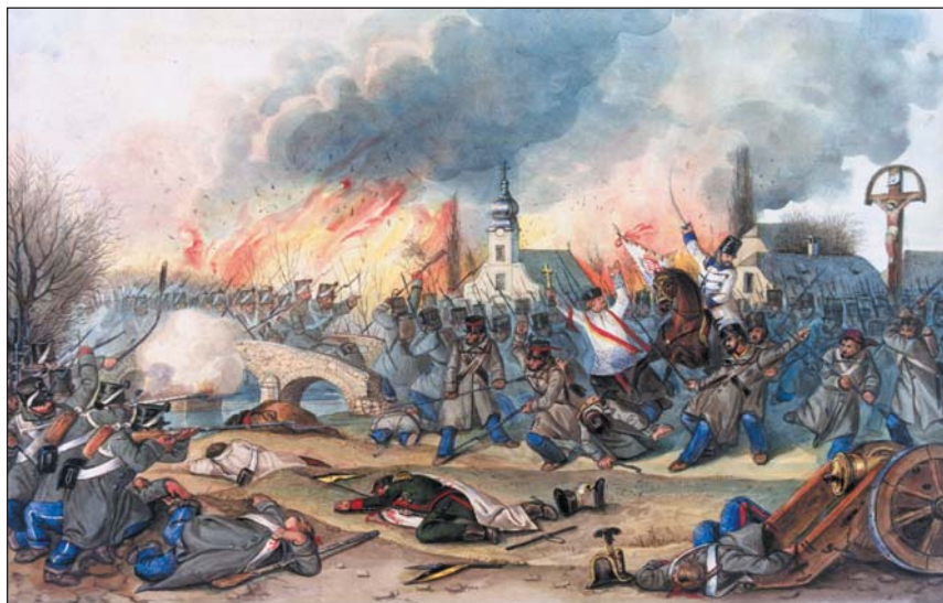
Сражение при Каполне 27 февраля 1848 года

Крупный шанс представился благодаря тому, что в 1848 году в Европе вспыхнули революции. Лидеры оппозиции Кошут и Баттяни, придерживавшиеся более радикальных убеждений, считали, что для осуществления их программы нужно воспользоваться сложившейся внешнеполитической ситуацией, представлявшей опасность для стабильности империи. Уже в конце февраля оппозиционные силы хотели склонить монарха к тому, чтобы правительство выступило поборником мира. Этого можно было бы добиться представлением со стороны императора конституции народам империи. Не следовало также посылать венгров для подавления национально-освободительного движения итальянского народа. Требование оппозиции свидетельствовало о широте ее подхода к вопросам внешней политики. По мнению как Баттяни, так и Кошута, свобода в Венгрии могла бы быть поставлена на прочные рельсы только при введении конституционного правления в наследных провинциях: ведь для сглаживания различий