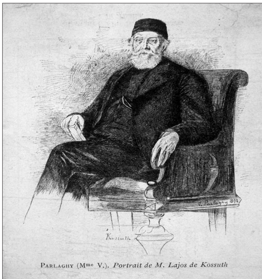
PARLAGHY (M me V.). Portrait de M. Lajos de Kossuth

Из-за резкого ухудшения материального положения Кошут был снова вынужден