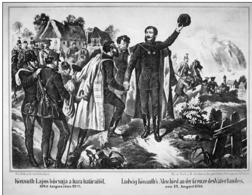
Kossuth Lajos búcsuja a hazai határaitól. 1849 Augustus 19 én . Ludwig Kossuth's Abschied an der Grenze des Vaterlandes. am 19. August 1849.

Когда Кошут узнал о том, что Франц-Иосиф (1830–1916), в соответствии с Ольмюцской – так называемой октроированной конституцией, – обнародованной 4 марта 1849 года, предусматривает раздробление Венгрии на куски, он принял решение о провозглашении независимости страны и низложении династии Габсбургов с венгерского престола. (Нацеленную на централизацию власти и пропитанную духом онемечивания Ольмюцскую кон-