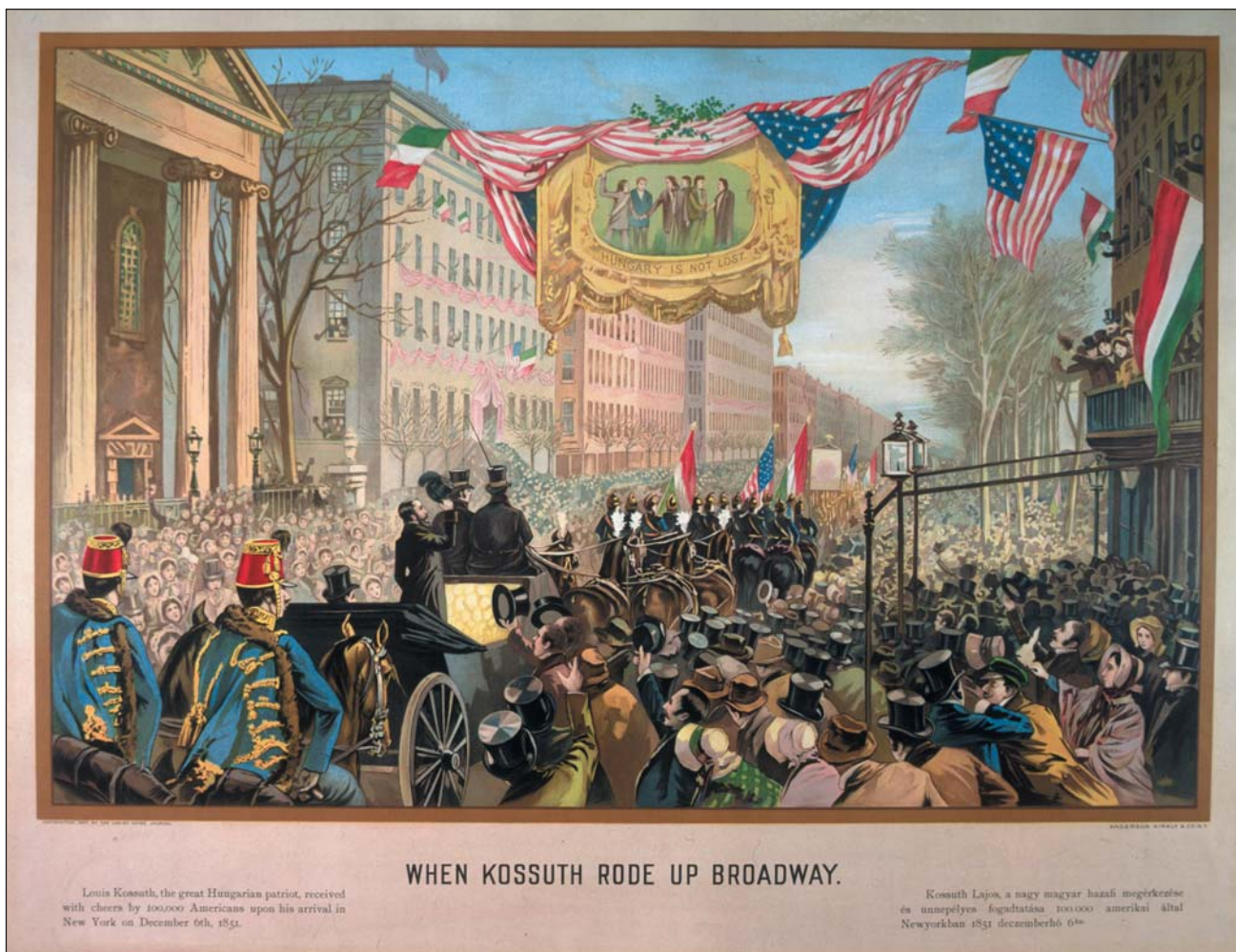
Louis Kossuth, the great Hungarian patriot, received with cheers by 100,000 Americans upon his arrival in New York on December 6th, 1851.