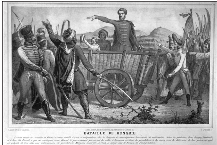
Выступление Кошута во время кампании по набору добровольцев в армию осенью 1848 года

Государственного собрания 1847–1848 годов Кошут принимал участие как депутат от комитата Пешт. Попытки правительства не допустить его избрания успеха не имели. В нижней палате оппозиция находилась в большинстве, но это не давало ей серьезного