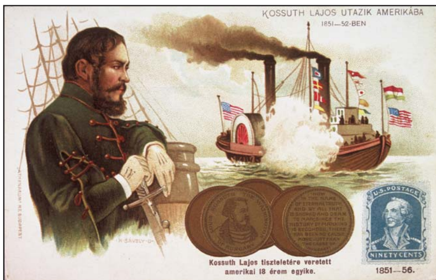
Памятная открытка, выпущенная в честь Кошута в Америке

государств, например России, в дела Венгрии, если венгры вновь развернут национально-освободительную борьбу. Речи Кошута в Соединенных Штатах Америки имели серьезное воздействие на президента страны Авраама Линкольна. В речи, произнесенной президентом в 1863 году в Гёттисбурге, мы встречаемся с данной Кошутом концепцией понятия «свободы»: «Демократия – дух нашей эпохи. Все – ради народа и все – через народ. Ничего плохого о народе, ничего хорошего без народа. Это – демократия и это – направление духа времени».