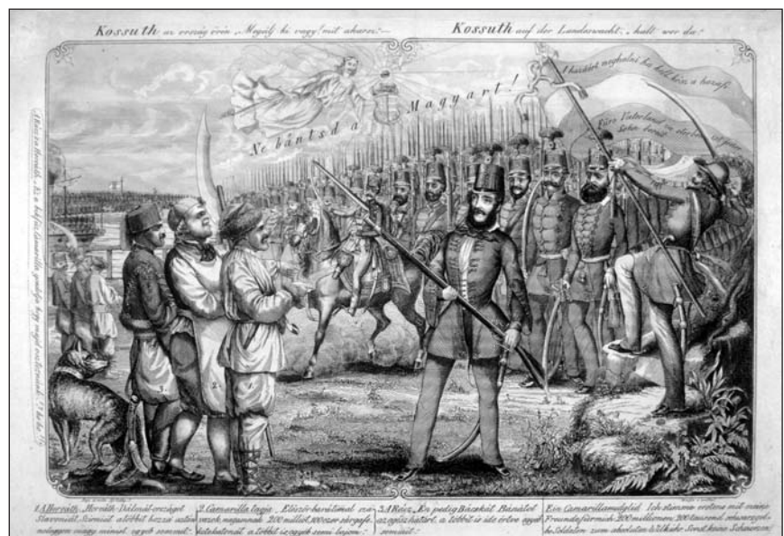
«Лайош Кошут на страже родины» (карикатура)