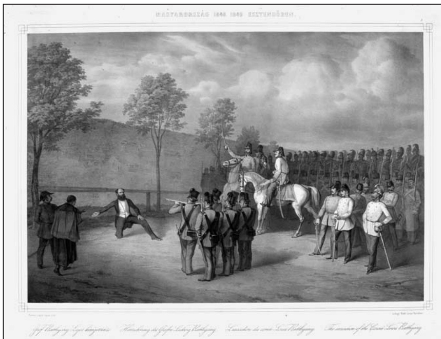
Казнь премьер-министра Лайоша Баттяни 6 октября 1849 года

Осенью 1851 года Кошут и его соратники смогли покинуть Кютахию. Путь Кошута сначала лежал в Англию, затем в Америку. Венгерский патриот-политик стремился пробудить за рубежом интерес к родине. Его выступления на английском языке вызвали повсюду симпатии. Цель Кошута заключалась в том, чтобы склонить правительства Англии и США к принятию принципа «вмешательство ради невмешательства». В данном конкретном случае он ждал от них таких шагов, которые могли бы воспрепятствовать вмешательству иностранных