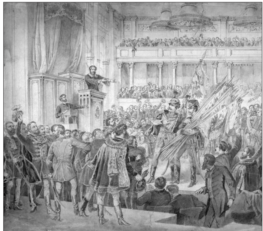
Знамена, захваченные в качестве трофеев в сражении при Озоре, были представлены Кошутым Государственному собранию 8 октября 1848 года

преимущества из-за активного сопротивления со стороны верхней палаты. Парламентская оппозиция (в нижней палате – во главе с Кошутым, в верхней – во главе с Баттяни) продолжала борьбу за проведение