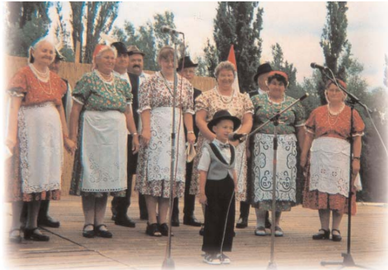
A műcsónyi ruszin népdalkör

Почти у каждого республиканского органа национального самоуправления уже есть свое здание, тем самым сформированным в 1995 году 11 органам самоуправления предоставлены основные условия для работы. Подыскиваются здания для размещения республиканских органов самоуправления украинского и русинского (закарпатско-украинского) национального меньшинства, существующих с 1999 года.