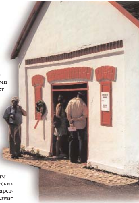
Német műemlék pince Palkonyán

В последние годы в законодательстве Венгерской Республики все лучше отражение находят интересы национальных меньшинств; издаются современные законы, отвечающие актуальным требованиям и с точки зрения конституционных гарантий основных прав меньшинств. Так, например, в соответствии с законом о радиовещании и телевидении, общественному телевидению и радиовещанию вменяется в обязанность подготовка программ, знакомящих с жизнью и культурой национальных меньшинств, а также выдающих информацию на их родных языках. В 1993 году в уголовный кодекс внесены изменения, определяющие правовую основу для уголовного преследования преступлений, связанных с расовой дискриминацией.