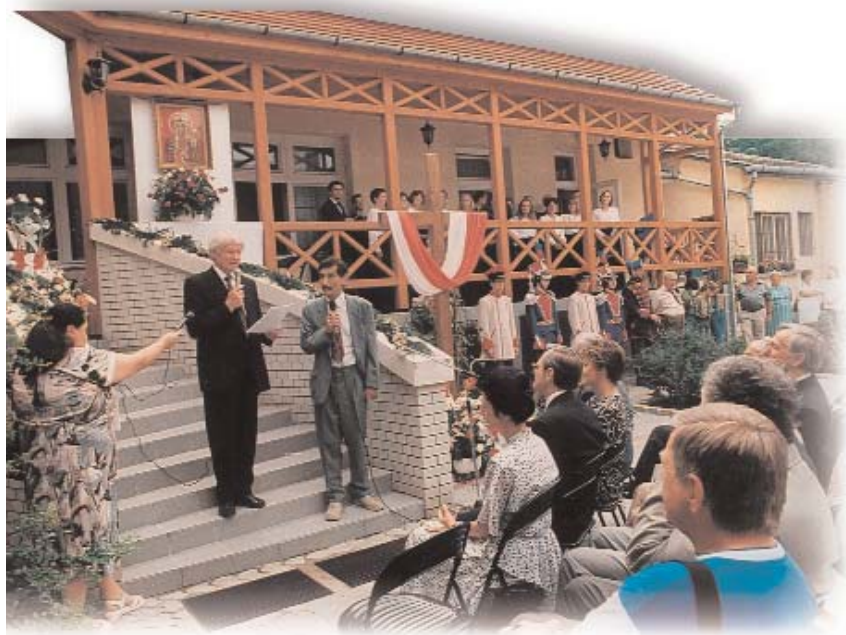
Az Országos Lengyel Kisebbségi Önkormányzat székházavató ünnepsége (1998. június 27-én)

В пакет мер, составленный на основании комплексного подхода, включены задачи в области образования, культуры, занятости, сельского хозяйства, регионального развития, социальной сферы,