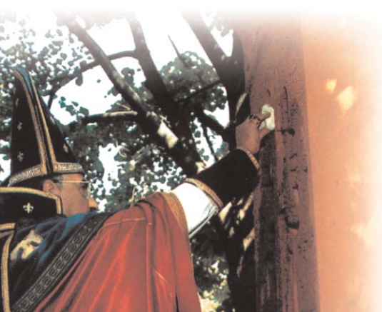
Az őrmény kereszténység 1700. évfordulójára Budapesten felállított keresztnek felavatása

самостоятельно принимают решения о принципах использования времени вещания, отведенного национальным программам некоммерческими органами масс-медиа.