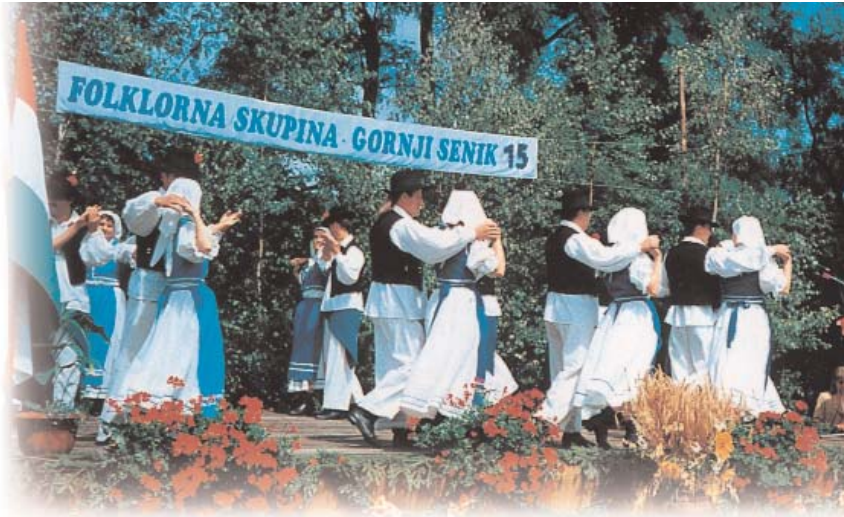
Szlovén ünnepség Felsőszölnökön (Gornji Senik)

Принадлежность к тому или иному национальному меньшинству на основании переписи народонаселения 1990 года можно было установить по ответам на три вопроса: национальность, родной язык, а также языки, на которых говорите. Три указанных фактора в плане этнической категории являются носителями информации неодинакового содержания. Дело в том, что сознание своей причастности к той или иной национальной группировке необязательно связано со знанием родного языка этого меньшинства. Под родным языком мы понимаем язык, усвоенный в детстве, на котором обычно разговаривают в семье. В то же время часть населения, говорящая на национальном языке, не отрицает и своей венгерской национальности. Поэтому дополнительную информацию может предоставить учет языков, которыми владеет конкретное лицо, кроме родного языка, если язык меньшинства не входит в число часто изучаемых, мировых языков. Последние данные, однако, указывают не только на меньшинства, которые не желают себя обнаружить, но и, например, на переселенцев в Венгрию или беженцев венгерской национальности, которые освоили язык той страны, где жили ранее.