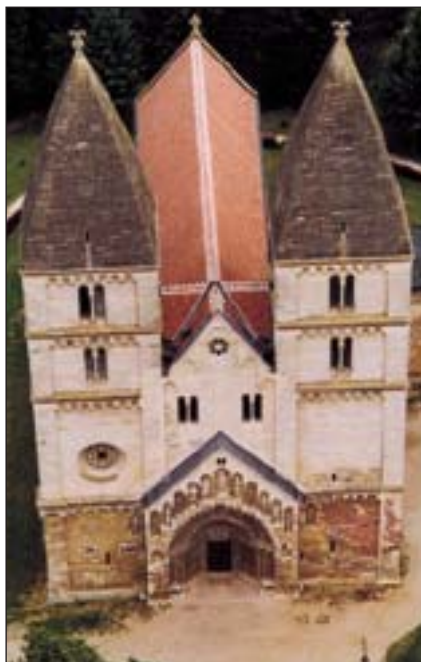
L'église de Ják, datant du XIII e siècle, est l'un des monuments les plus prestigieux de Hongrie

tartares occupés peu à peu par la Russie à l'appétit d'ogre. A cette époque, la Hongrie faisait figure de citadelle puissante des chrétiens d'Occident. La dynastie du conquérant Árpád avait donné à l'Eglise plus de saints que toute autre Maison royale catholique, les chevaliers hongrois participèrent aux campagnes des croisés destinées à libérer la Terre sainte et le pays assumait une certaine mission