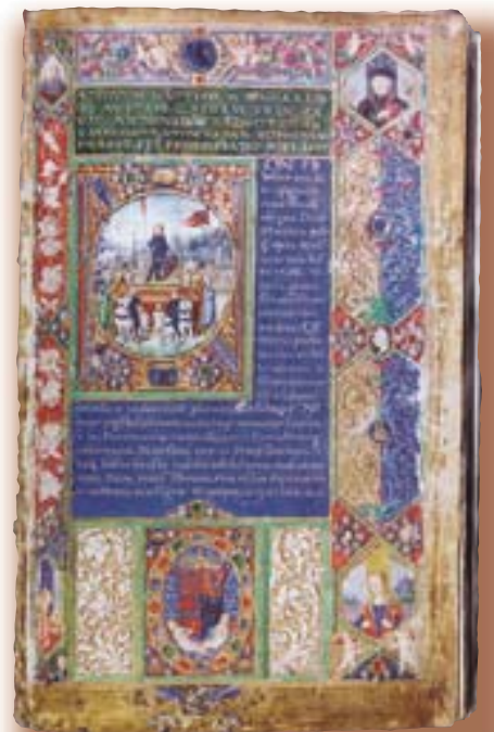
La bibliothèque du roi Mátyás (Mathias) comptait 2000 à 2500 Corvins de ce type. 216 volumes ont survécu aux vicissitudes de l'histoire, 53 d'entre eux sont restés en Hongrie

hongrois, János Hunyadi, parvint à enrayer pour plusieurs décennies la progression de l'armée turque en 1456 près de Nándorfehérvár (auj. Belgrade). C'est grâce à cette victoire, ayant définitivement sauvé l'Europe chrétienne de l'occupation ottomane, que le fils de Hunyadi, devenu roi de Hongrie sous le nom de Mátyás (Mathias), n'eut pas de conflits militaires majeurs avec le Sultan et que, par conséquent, il put se consacrer entièrement au renforcement de ses