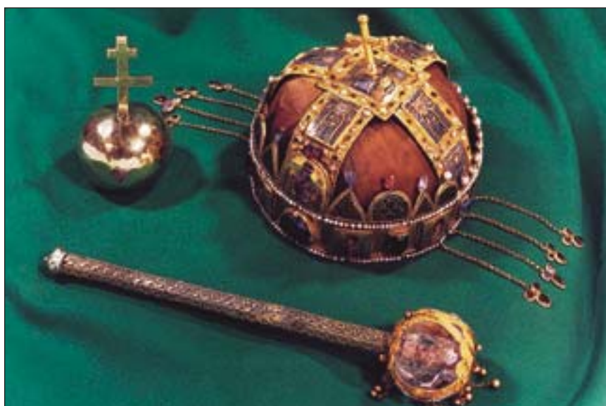
Les insignes du couronnement des rois de Hongrie sont des reliques nationales

Saint Etienne, se joignit avec son peuple à la chrétienté d'Occident. Le nombre des clercs utilisant avant tout le latin, en tant que langue universelle de l'écriture dans l'Europe médiévale, augmenta sans cesse dans les cloîtres, les chancelleries royales et les chapitres. Dans le même temps, les monuments gravés dans la pierre de l'ancienne écriture runique de l'époque païenne ont été conservés (par exemple dans les églises de Transylvanie). Ceux rédigés en caractères latins apparurent également de bonne heure. Le premier fragment de texte en hongrois, l'Oraison funèbre traduite du latin, date du milieu du XII e siècle, et la première adaptation en vers, la Complainte de Marie, d'un