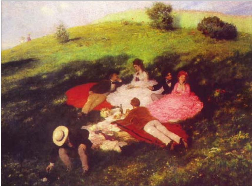
Le premier représentant hongrois de renom de l'impressionnisme, Pál Szinyei Merse (1854-1920) a peint son tableau Déjeuner champêtre en 1873

autoritaire, les écrivains jouèrent un rôle de toute première importance. Le soulèvement débuta par une manifestation de masse de la jeunesse estudiantine, et ce n'est qu'à la suite de