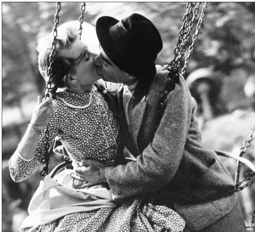
Marie Töröcsik et Imre Soós dans une belle scène du film de Zoltán Fábri (1917-1994), Un petit carrousel de fête

faveur de la crise généralisée de l'empire soviétique vers la fin de cette décennie, on assista au démarrage du processus de démocratisation qui conduisit à la chute du régime en place. L'un des signes en était la multiplication des partis soit historiques (petits propriétaires, chrétiens-démocrates) soit de création récente (Forum démocratique hongrois, Alliance des démocrates libres, Fédération des jeunes démocrates, Parti socialiste hongrois formé après la désagrégation du Parti Socialiste Ouvrier Hongrois). A l'issue des premières élections multipartites de 1990, il se constitua un gouvernement de centre-droite dirigé par József Antall, et avec Árpád Göncz