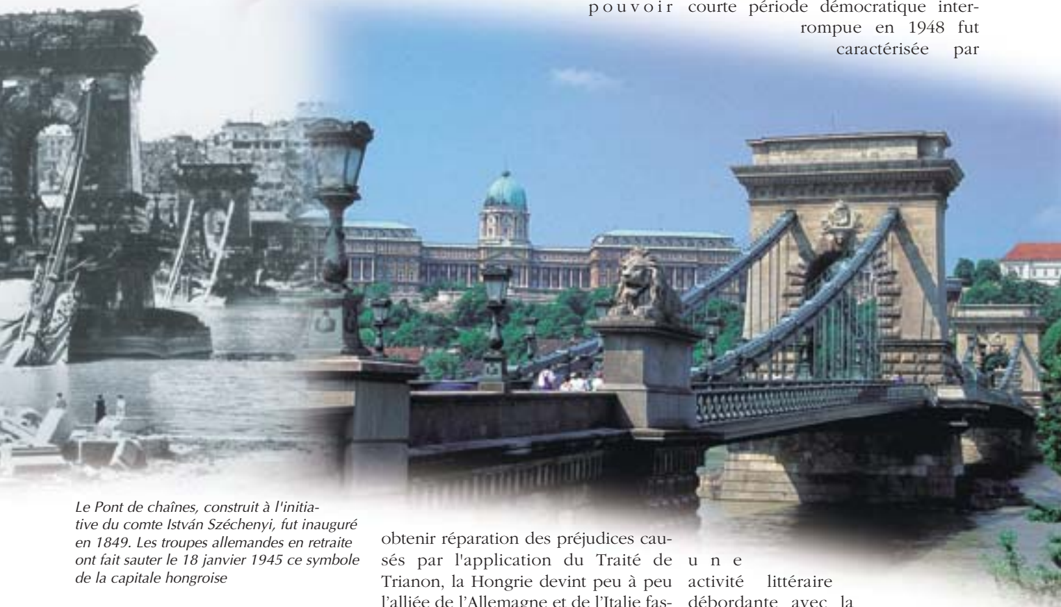
Le Pont de chaînes, construit à l'initiative du comte István Széchenyi, fut inauguré en 1849. Les troupes allemandes en retraite ont fait sauter le 18 janvier 1945 ce symbole de la capitale hongroise

toire hongrois en un vaste champ de bataille, la déportation et l'extermination de la majeure partie des juifs de Hongrie. Au retour de la paix, les hommes de lettres jouèrent un rôle important dans la renaissance morale et spirituelle de la nation hongroise. La courte période démocratique interrompue en 1948 fut caractérisée par