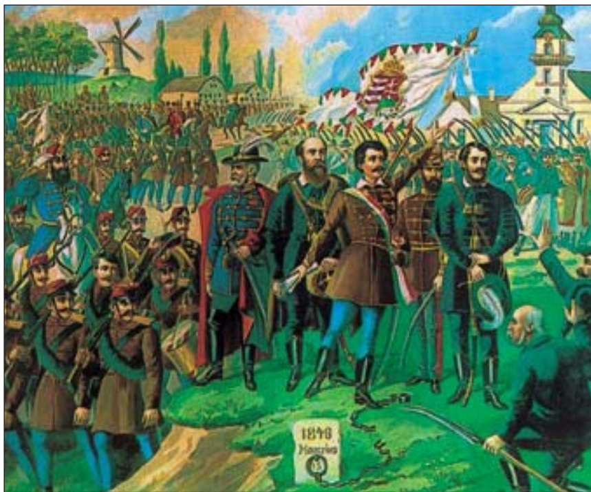
Lithographie d'ambiance pathétique représentant les chefs de la révolution et guerre d'indépendance antihabsbourgeoise de 1848-1849. Au centre du groupe, le poète Sándor Petőfi lève la main

Hongrie du XVIII e siècle connut quelques décennies de calme relatif, dû en grande partie à la politique tolérante et compréhensive de la reine Marie-Thérèse, le premier souverain habsbourgeois qui avait su conquérir le cœur des Hongrois. Aux ravages de la période précédente succéda alors la reconstruction du pays. Les palais, les