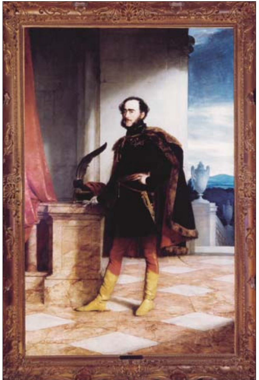
Le portrait du plus grand des Hongrois, István Széchenyi (1791-1860), a été peint par Friedrich von Amerling (1803-1887)

Arany évoquent les chapitres les plus glorieux de l'histoire hongroise, les romans de Mór Jókai sont de véritables épopées célébrant l'attachement des Hongrois à leur liberté. Dans ses romans historiques et ses études politiques, Zsigmond Kemény exprime la nécessité de la prise de conscience de la nation et d'une politique conforme à la raison. L'auteur dramatique Imre Madách crée dans la Tragédie de l'Homme une vision mythique de l'histoire et de l'avenir de l'humanité. Les grandes figures de la musique nation-