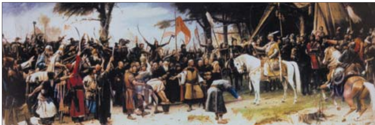
Le tableau historique intitulé La conquête du pays , de Mihály Munkácsy (1844-1900), orne le Parlement de la République de Hongrie

La naissance de notre culture et de notre littérature nationales, qu'il s'agisse des traditions folkloriques ou des premiers monuments écrits, se perd dans la nuit des temps. Par contre, les connaissances relatives aux origines, aux migrations et à l'établissement des Magyars sont consignées dans de nombreuses légendes historiques parvenues jusqu'à nous. L'usage de l'écriture en Hongrie remonte probablement plus loin que ne l'attestent les monuments conservés, compte tenu du fait que la culture religieuse et profane y fleurit depuis mille ans, date à laquelle le premier roi de Hongrie,