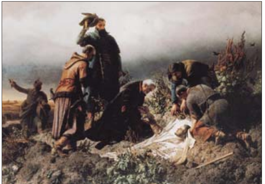
Le tableau de Bertalan Székely (1835-1910) représente la scène où l'on retrouve le corps du roi Lajos (Louis) II, après la défaite de Mohács, subie par les Hongrois en lutte contre les Turcs en 1526

Ensuite, c'est grâce aux efforts des promoteurs de la culture, plus exactement de la littérature hongroise, que la nation réussit à retrouver sa vigueur d'antan. Les représentants de la Réforme luthérienne puis calviniste, mais aussi ceux du renouveau catholique, étaient pleinement conscients de l'importance d'une culture nationale. Les incarnations les plus illustres de l'esprit créateur hongrois à l'époque avaient nom Bálint Balassi, figure de proue de la poésie Renaissance hongroise, Péter Pázmány, grand orateur religieux et fondateur d'université défendant les thèses de la Contre-Réforme, et Miklós Zrínyi, chef d'armée doublé d'un poète, auteur d'une épopée baroque intitulée Szigeti vészedelem (Le Désastre de Sziget). Aux yeux des Habsbourg et du Sultan, la Hongrie se situait aux confins de l'empire germanique et n'avait donc pas droit à l'indépendance, pour laquelle luttèrent en premier lieu les princes de Transylvanie, István Bethlen, Gábor Bethlen, ayant combattu les souverains de la Maison d'Autriche, puis Ferenc (François) II Rákóczi, élu prince des Ordres hongrois.