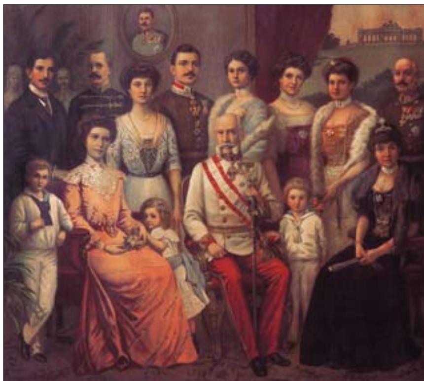
François-Joseph I er (1830-1916), empereur d'Autriche et roi de Hongrie au sein de sa famille, à la veille du déclenchement de la Première Guerre mondiale

le, Ferenc Erkel et Ferenc Liszt, servent par leurs œuvres et par leur engagement personnel le renforcement du sentiment d'identité de la nation.