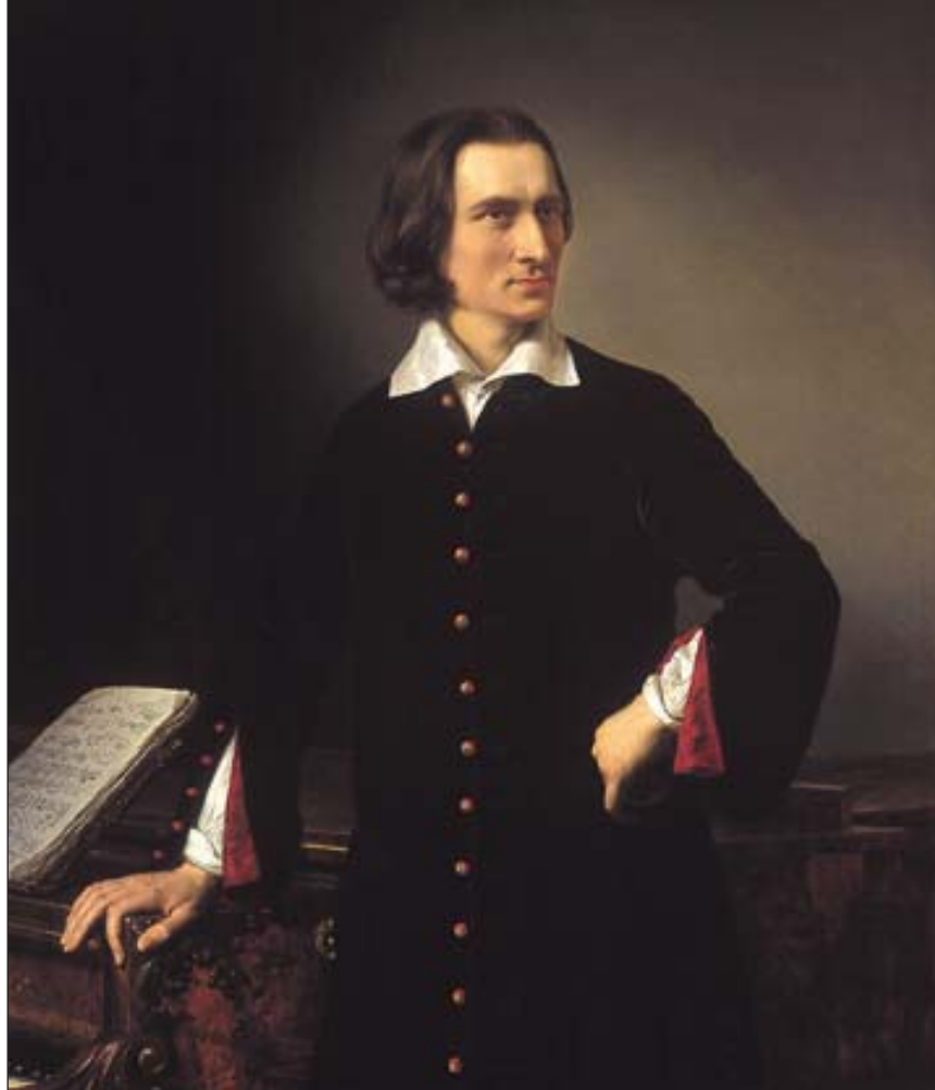
Portrait de Ferenc Liszt (1811-1886), pianiste virtuose et compositeur célèbre, par Miklós Barabás (1840-1898)