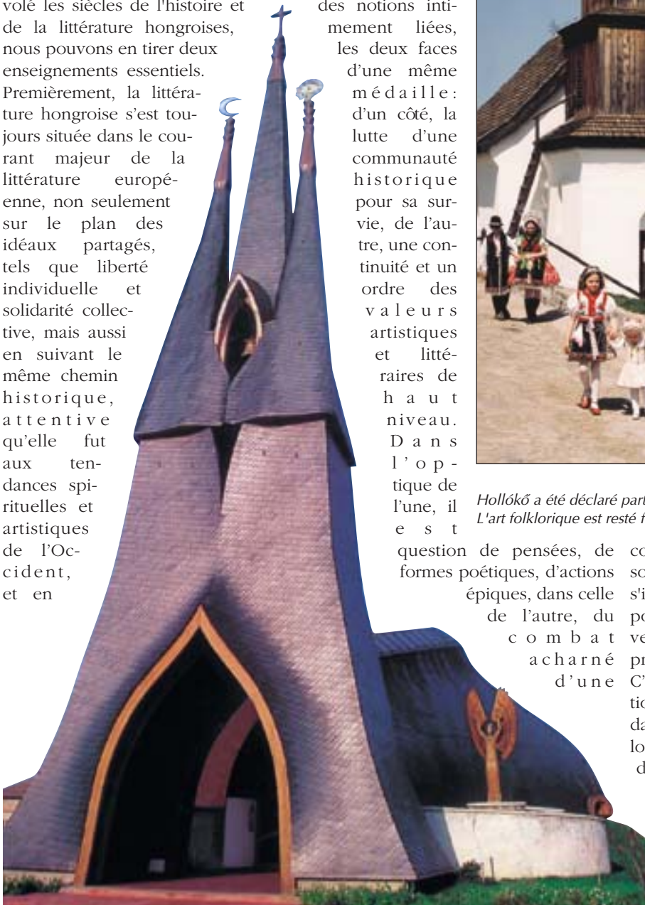
L'église catholique de Paks, conçue et construite par Imre Makovecz, est caractérisée aussi bien par le respect des traditions que par la modernité