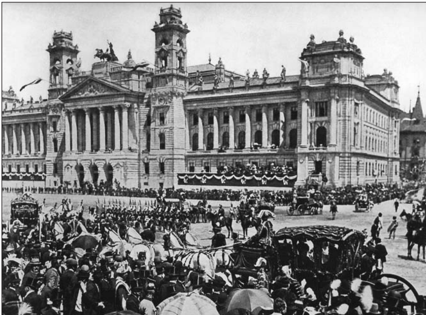
Au cours de la deuxième moitié du XIX e siècle et dans les premières années du vingtième, Budapest est devenu une métropole. Ses bâtiments les plus beaux ont été construits en grande partie à l'occasion du Millénaire de la Conquête du pays. A cette même époque ont été organisées des festivités grandioses

par des jeunes ouvriers et intellectuels. Le gouvernement révolutionnaire, avec à sa tête Imre Nagy, représentant de l'aile réformiste du parti communiste et solidaire des revendications