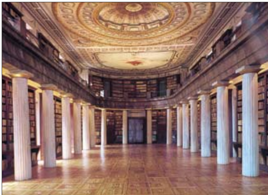
La bibliothèque classiciste du Collège Protestant de Sárospatak, fondé en 1531, a été conçue par Mihály Pollack (1773-1855)