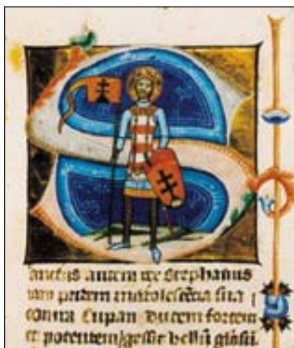
Figuration du roi Saint Etienne (975-1038) dans la Chronique illustrée (1358)

Saint Etienne, se joignit avec son peuple à la chrétienté d'Occident. Le nombre des clercs utilisant avant tout le latin, en tant que langue universelle de l'écriture dans l'Europe médiévale, augmenta sans cesse dans les cloîtres, les chancelleries royales et les chapitres. Dans le même temps, les monuments gravés dans la pierre de l'ancienne écriture runique de l'époque païenne ont été conservés (par exemple dans les églises de Transylvanie). Ceux rédigés en caractères latins apparurent également de bonne heure. Le premier fragment de texte en hongrois, l'Oraison funèbre traduite du latin, date du milieu du XII e siècle, et la première adaptation en vers, la Complainte de Marie, d'un