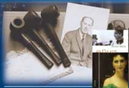
Шандор Марай (1900-1989)

«Он разговаривал тихо и вежливо, поощрял друг друга: обильные старыми деревьями высокие стены окружали слова, складывая виллы, оловянные, как дерево, музыкальные аксиомы, летела импрессионная лучшая струна».