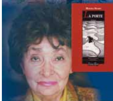
Магда Сабо (1917)

За последние пять лет за рубежом вышло в свет примерно 500 интереснейших романов и сборников поэзии. Мирной удачи заслужила книга романа Шандора Марая «Улыбка», который переведен на 24 языка. Роман «Без судьбы» Ивры Кертеса – лауреата Нобелевской премии 2002 года – выдвинул на литературном конкурсе – уже переведен на 20 языков. Сейчас идет работа над его переводом еще на пять языков. Среди современных венгерских писателей, пользующихся популярностью за рубежом, наряду с Иврой Кертесом, фигурируют Петер Эстерхаз (Премия Габриэля 2002 года, Литературная премия Гринвиче Канура 2003 года), Дадель Конрад (Австрийская премия Карла Великого 2001 года), Петер Налаи (Большая ерн Лайонисской книжной премии 1995 года, Большая литературная премия и хрустальный кубок «Видеоскоп» 1998 года) и Магда Сабо (Парижская премия «Prix Femina» 2003 года).