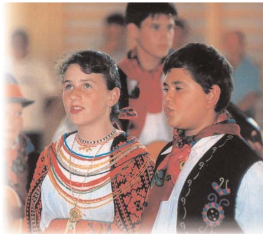
Jóvenes de la minoría nacional Croata en traje nacional

La Ley LXXVII del año 1993 acerca de los derechos de las minorías nacionales y étnicas, entre los derechos individuales de las minorías, estipula lo siguiente: "El asumir y declarar la pertenencia a algún grupo de nacionalidad, étnico, o a una minoría ... constituye un derecho exclusivo e inalienable del individuo. Nadie podrá ser forzado a declarar si pertenece o no a algún grupo de minorías." Según los datos del censo nacional de 1990, de la población del país, 10.374.823 habitantes, 232.751 personas admitieron pertenecer a alguna minoría y 137.724 personas declararon como lengua materna el idioma de alguna minoría nacional o étnica. Según estimaciones de los investigadores y de las organizaciones de las