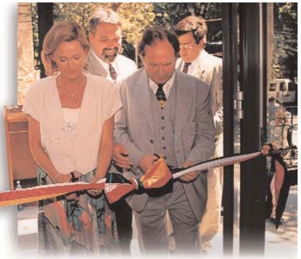
La ministra de Justicia, Iboľya Dávid, y el embajador alemán, Wilfried Gruber, inauguran la casa de Budapest de los alemanes de Hungría

En los últimos 5 años el sistema autonómico de las minorías demostró de