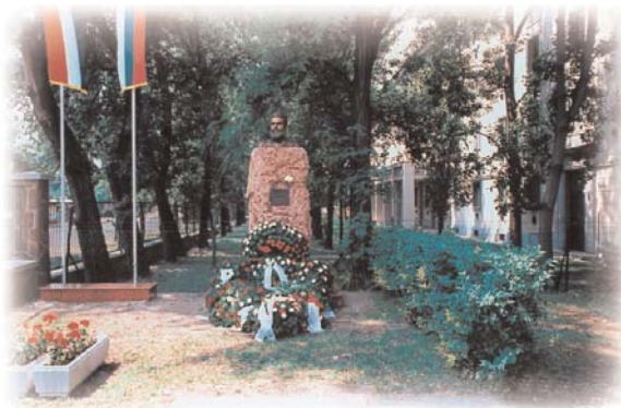
Estatua del poeta búlgaro, Hriszto Botev, en Budapest

otros está ligado a la autonomía nacional o a alguna universidad.