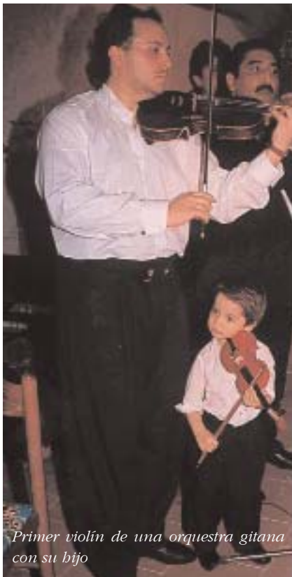
Primer violín de una orquesta gitana con su hijo

Existen tres tipos de escuelas de minorías. Hay escuelas que imparten el idioma de la minoría como un idioma extranjero, hay escuelas bilingües, en las cuales las asignaturas de humanidades, por ejemplo la historia, la literatura y la geografía se enseñan en la lengua materna, mientras que las asignaturas de ciencias