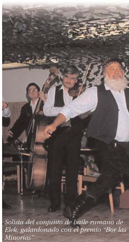
Solista del conjunto de baile rumano de Elek, galardonado con el premio "Bor las Minorías"

El objetivo de la creación de las autonomías de las minorías es garantizar la autonomía cultural. De acuerdo con ello, constituye un derecho asegurado por ley de las autonomías de las minorías, el poder decidir independientemente, dentro de su propia competencia, acerca de la fundación, la toma y el mantenimiento de instituciones, especialmente en los terrenos de la enseñanza pública local, de los medios de comunicación escritos y