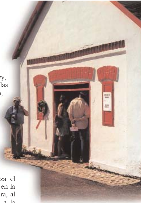
Bodega monumento alemán en Palkony (Palkan)

En 1993 la Asamblea Nacional promulgó la Ley LXXVII sobre los derechos de las