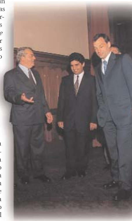
El 17 de junio de 1999, el Primer Ministro, Viktor Orbán recibe al presidente de la Autonomía Nacional Gitana, Flórián Frakas. A su lado, se encuentra el presidente de la Oficina de Minorías Nacionales y Étnicas, Doncsev Toso

pleo juvenil. El problema se agudiza aún más por el hecho de que los gitanos viven en mayor número en regiones geográficas donde se redujeron sobremedida las posibilidades de encontrar empleo en la industria pesada, a raíz de la reconversión industrial posterior al cambio de sistema político. Los gitanos frecuentemente son objeto de discriminación en su trabajo y durante los acontecimientos de su vida cotidiana.