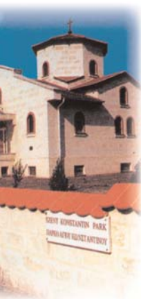
Iglesia ortodoxa en la aldea griega de Beloiannis