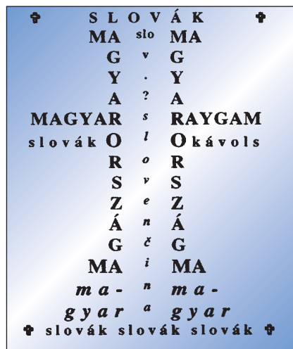
Poema ilustrado de Imre Fubl: "Ukrizorana", (Crucifixión)

bieron en 1998 398 millones, en 1999 se entregaron 496,3 millones de forint, en 2000 554,3 millones de forint. En 1998 pudieron emplearse, para ayudar a las autonomías locales de las minorías 350 millones de forint. En 1999 el presupuesto estatal asignó