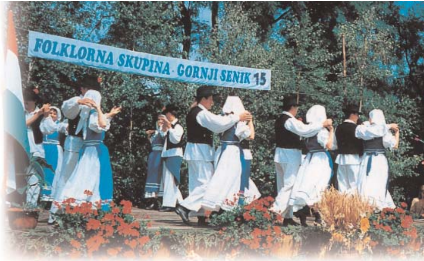
Fiesta eslovena en Felsőszölnök (Gornji Senik)

Del censo del año 1990, se pudo sacar conclusiones referentes a la pertenencia a minorías sobre la base de tres preguntas: la respectiva a la nacionalidad, a la lengua materna y al idioma hablado. Estos tres criterios encierran, en el caso de las minorías de Hungría, informaciones de contenido distinto respecto a la pertenencia étnica. Por lo demás, el hecho de admitir la pertenencia a una minoría no supone en sí el conocimiento de la lengua materna de la minoría en cuestión. Entendemos por lengua materna el idioma aprendido en la infancia, que se habla por lo general en la familia, no obstante una parte de la población que habla una lengua materna minoritaria, se considera de nacionalidad húngara.