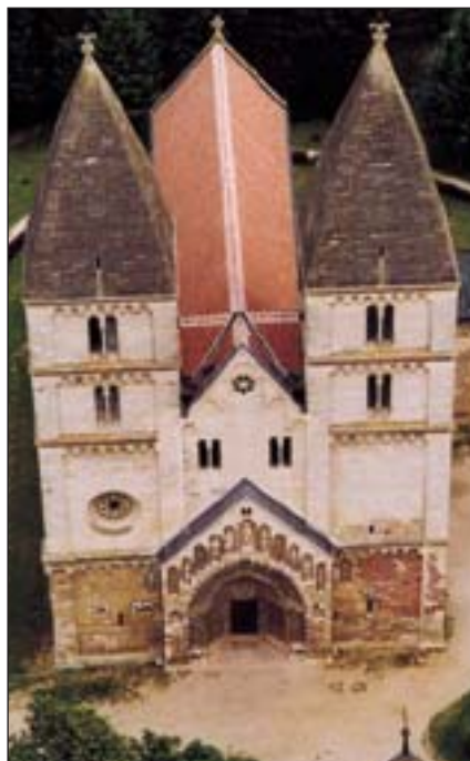
A XIII. századi jáki templom Magyarország egyik legértékesebb műemléke

foglaló vezértől, Árpádtól származó uralkodóház több szentet adott az egyháznak, mint bármelyik más katolikus dinasztia. A magyar lovagok, lovagkirályok ott voltak a szentföldi keresztes hadjáratokban, s az ország bizonyos térítő és kultúráközvetítő szerepet vállalt kelet és dél felé. A magyar királyság már a középkor évszázadaiban a nyugati kereszténység védőbástyájának számított, és való-