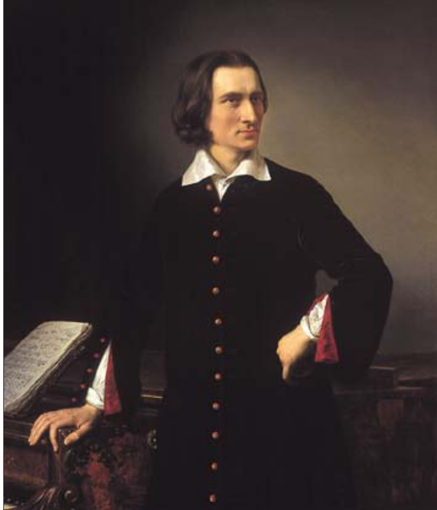
A virtuóz zongorista és kiváló zeneszerző Liszt Ferenc (1811-1886) Barabás Miklós (1810-1898) festményén