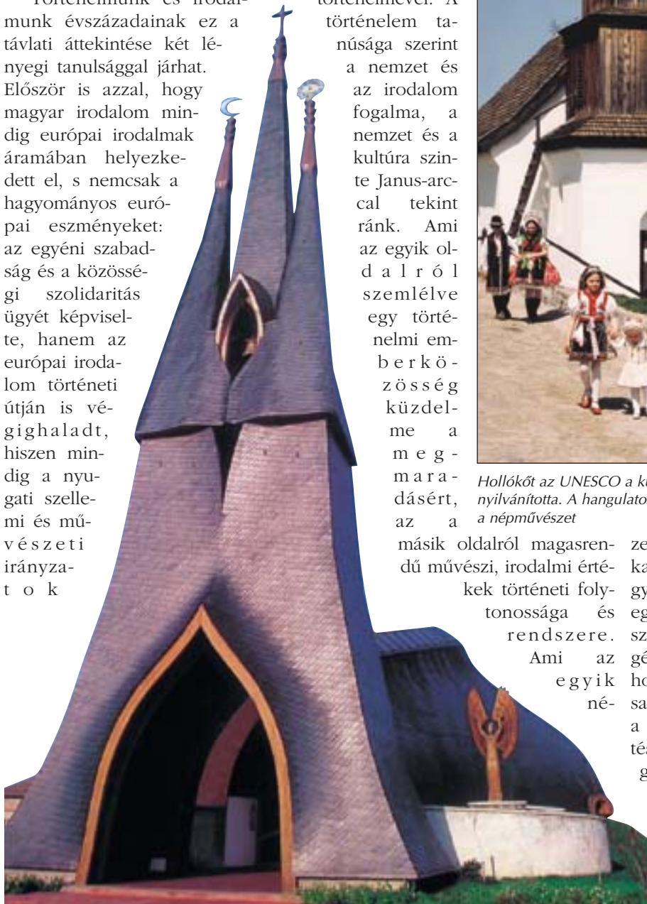
A Makovecz Imre által tervezett paksi római katolikus templomot egyaránt jellemzi a hagyománytiszteltetés és a korszerűség

zetben gondolat, költői forma és epikai cselekmény, az a másikban gyötrődő küzdelem avégett, hogy egy emberi közösség otthon találjon szülőföldjén és a nemzetek közösségében, s lehetőséget kapjon arra, hogy megőrizze és a világ elé tárja saját szellemi és erkölcsi értékeit. Ez a kettős szellemi törekvés és küldetés mutatkozhat meg teljes gazdagságában 2000-ben, midőn Magyarország Szent István király történelmi művének emlékéit idézi fel s tárja a nemzetek közössége elé.