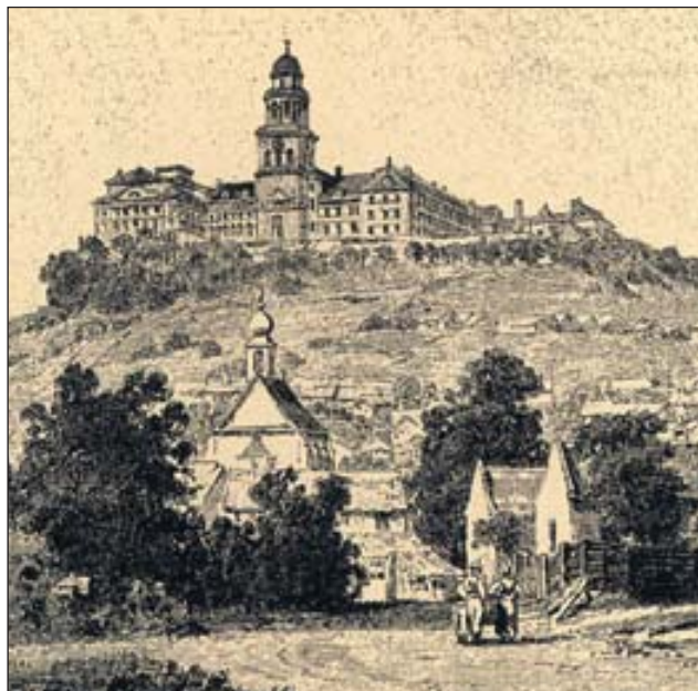
Pannonhalmán a bencés apátságban több, mint ezer év óta működik iskola

foglaló vezértől, Árpádtól származó uralkodóház több szentet adott az egyháznak, mint bármelyik más katolikus dinasztia. A magyar lovagok, lovagkirályok ott voltak a szentföldi keresztes hadjáratokban, s az ország bizonyos térítő és kultúráközvetítő szerepet vállalt kelet és dél felé. A magyar királyság már a középkor évszázadaiban a nyugati kereszténység védőbástyájának számított, és való-