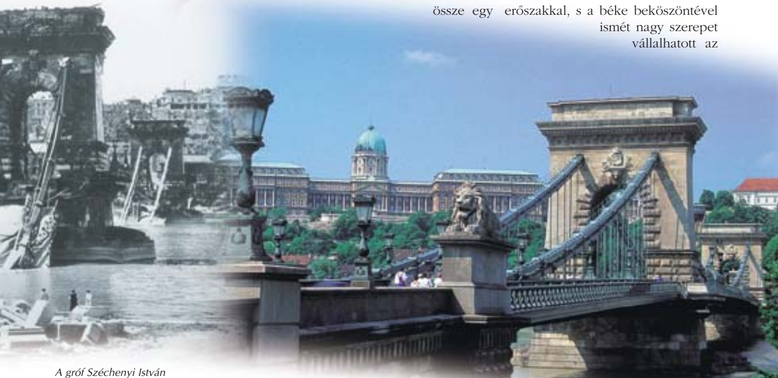
A gróf Széchenyi István kezdeményezésére épített Lánchidat 1849-ben adták át. A visszavonuló német csapatok 1945. január 18-án felrobbantották a magyar főváros jelképét

dultak azzal az 1944 tavaszán bekövetkezett hitleri megszállással is, amely az országot kiszolgáltatotta a hadi cselekményeknek, és a magyar zsidóság elhurcolásához, nagy részben elpusztításához vezetett. Irodalmunk szembefordult a háborús erőszakkal, s a béke beköszöntével ismét nagy szerepet vállalt az