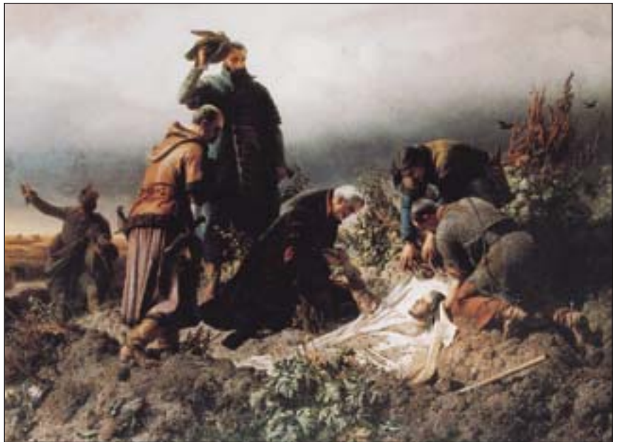
Székely Bertalan (1835-1910) festménye azt a jelenetet ábrázolja, amikor a törökök elleni 1526-os mohácsi csatavesztés után megtalálják II. Lajos király holttestét

A történelmi vereségek után a nemzeti kultúra, mindenekelőtt az irodalom szervezte újjá a magyarság életerejét. Ezt az életerőt szolgálta a magyar földre is elérkező lutheri, majd kálvini reformáció, amely az anyanyelvű művelődés további kibontakozását segítette, de ezt szolgálta a katolikus megújulás is, amely ugyancsak felismerte a nemzeti kultúra fontosságát. A török háborúk és a reformációs küzdelmek korában Balassi Bálint, a magyar reneszánsz költészet legnagyobb egyénisége, a katolikus ellenreformációt szervező kiváló hitszónok és egyetemalapító, Pázmány Péter és Zrínyi Miklós, a Szigeti veszedelem című barokk hősi eposzt megalkotó sikeres hadvezér munkásságában bontakozott ki a magyar alkotó szellem. A török hódítás és a Habsburg-kormányzat Magyarországot a császári birodalom határövezetének tekintet-