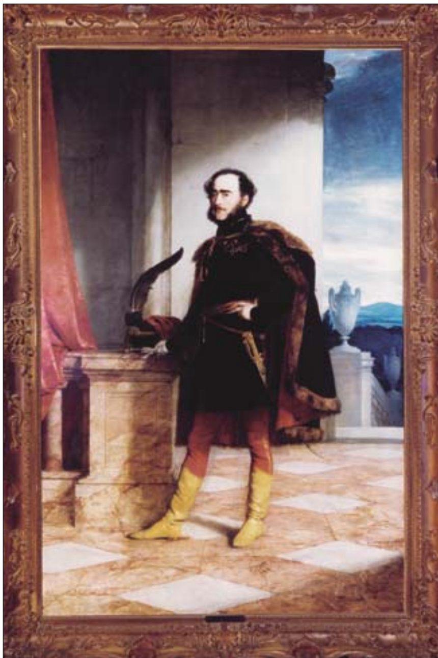
A legnagyobb magyarnak tartott gróf Széchenyi István (1791-1860) portréját Friedrich von Amerling (1803-1887) festette

ményeket adjanak a kiábrándult magyarságnak. Arany elbeszélő költeményei a magyar történelem fényesebb napjait idézték fel, Jókai Mór valóságos hőskölteményeket alkotott regényeiben a magyarság szabadságszeretetéről, Kemény Zsigmond történelmi regényeiben és politikai tanulmányaiban a nemzeti önismeret és a józan reálpolitika követelményét szóltatta meg, Madách Imre pedig az egész emberiség történetének és jövőjének mítikus vízióját jelenítette meg Az ember tragédiája