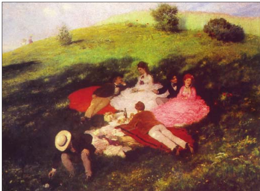
Magyarországon az impresszionizmus első nagy képviselője Szinyei Merse Pál (1854-1920). A Majális című képét 1873-ban festette

mi előkészítői között ugyancsak nagy szerepet tölthettek be az írók. A felkelés az egyetemi ifjúság tömegtüntetésével kezdődött, és a karhatalom fegyveres fellépése, majd a szovjet csapatok be-