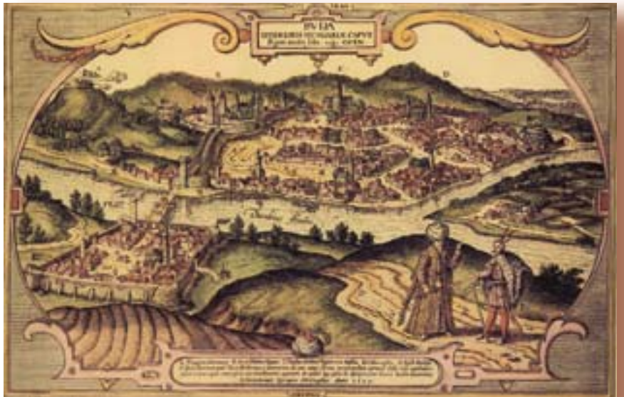
Buda látképe egy 1617-es metszeten, a törökök hódítása idején

kulturális fejlődés fontos szervezője volt. A nemzeti kultúra a szűkösebb erdélyi fejedelmi udvarban, a főnemesség kastélyaiban, a püspöki ауszállók Bocskai István, Bethlen Gábor, lálkban és az egyházi iskolákban, ko-