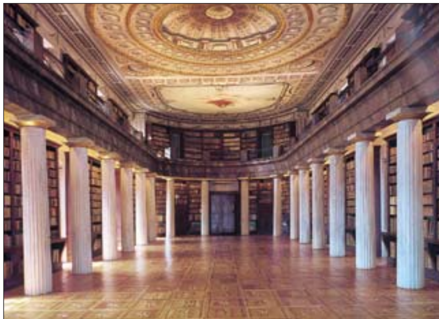
Az 1531-ben alapított sárospataki Református Kollégium klasszicista könyvtárát Pollack Mihály (1773-1855) tervezte