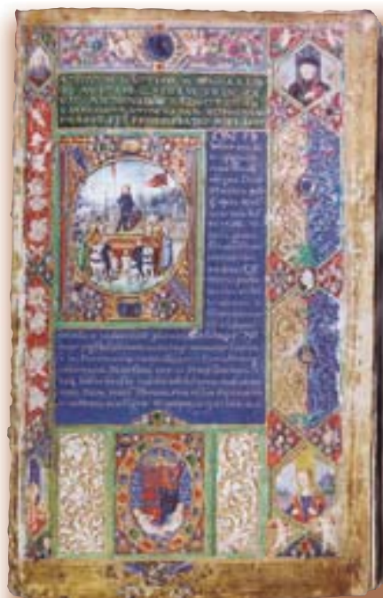
2000-2500 darab ilyen Corvina sorakozott Mátyás (1443-1490) könyvtárában. A történelem viharait 216 kötet élte túl, közülük jelenleg 53 található Magyarországon

vereséget mért a török seregekre. Ennek a győzelemnek – amely valójában a keresztény Európát végképp megszabadította a török terjeszkedéstől – volt köszönhető, hogy Hunyadi fiának, a királyi trónra emelt Mátyásnak csak kisebb török háborúkba kellett bonyolódnia, következésképp nyugaton próbált birodalmat építeni, hogy majd ennek erejét fordítsa szembe a törökkel. A nyugati világrendben elhelyezkedő magyar királyság biztos gazdasági alapra