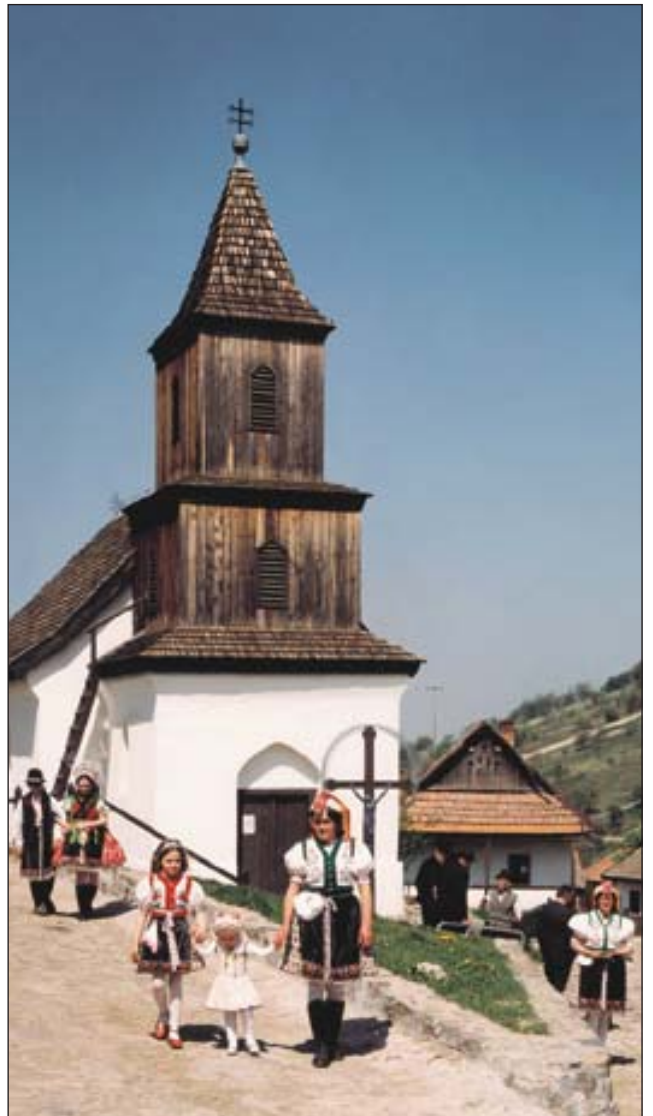
Hollóköt az UNESCO a kulturális világörökség részének nyilvánította. A hangulatos faluban napjainkig élő maradt a népművészet

medrében kerestek eszményeit és mindig alkotó módon járult hozzá az európai kultúra fejlődéséhez. A másik nagy tanulság abban áll, hogy irodalmunk mindig szervesen összefonódott a nemzet életével, törekvéseivel és történelmével. A történelem tanúsága szerint a nemzet és az irodalom fogalma, a nemzet és a kultúra szinte Janus-arcú tekint ránk. Ami az egyik oldalról szemlélve egy történelmi emberközösség küzdelme a megmaradásért, az a