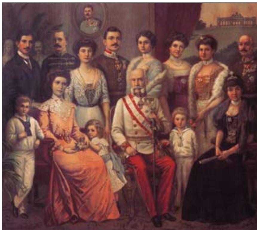
I. Ferenc József (1830-1916) Ausztria császára és Magyarország királya családjában az I. világháború kitörésének előestéjén

című drámájában. Hasonló szerepet töltött be a nemzeti zene: Erkel Ferenc operái, Liszt Ferenc muzsikája (és személyes szerepvállalása) maguk is a nemzeti identitás megerősítését szolgálták.