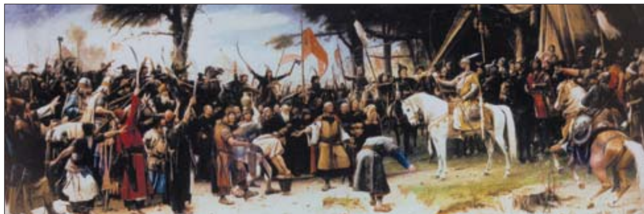
Munkácsy Mihály (1844-1900) Honfoglalás című történelmi tablója a Magyar Köztársaság Országgyűlésének épületét díszíti

Nemzeti kultúránk, irodalmunk születését, akár a nép ajkán megszólaló hagyományra, akár az írásos kultúra első nyomaira gondolunk, a rég-múlt homálya fedi. A magyarság származásáról, vándorlásáról és honfoglalásáról igen sok történeti monda maradt ránk. A magyar írásbeliség is valószínűleg régebbi, mint ezt a fennmaradt emlékek mutatják, hiszen a magyar egyházi és udvari kultúrának már közel ezeréves múltja van, és attól kezdve, hogy Szent István, első királyunk népével együtt a nyugati kereszténységhez csatlakozott, a kolostorokban, a káptalanokban, a királyi kancelláriákban mindinkább növekedett az írástudók száma, igaz, ezek akkor elsősorban a középkori Európában általános latin nyelvet használták. Ugyanakkor