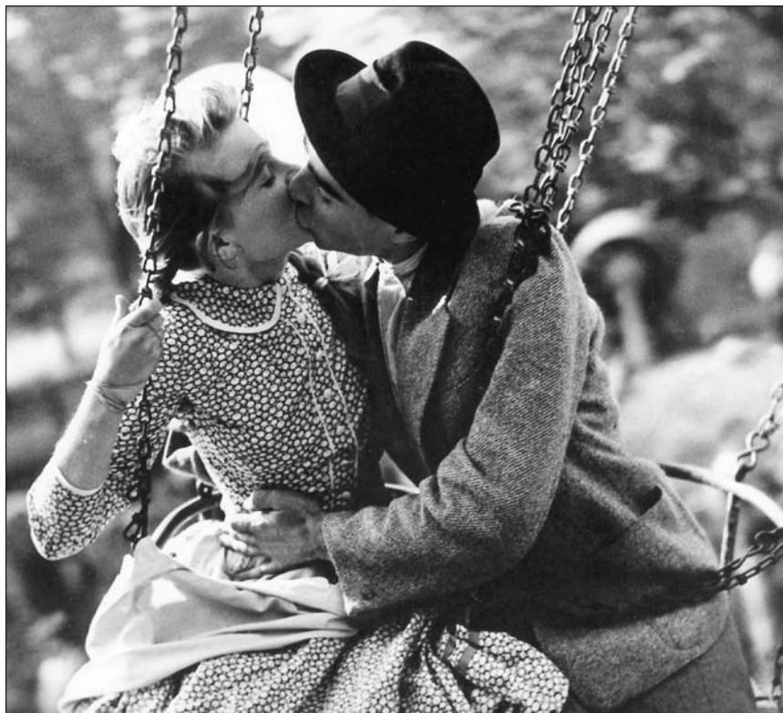
Töröcsik Mari és Soós Imre Fábri Zoltán (1917-1994) Körhinta című filmjének egyik szép jelenetében

kai folyamat. Ennek eredményeként ismét létrejöttek a történelmi pártok: a kisgazdapárt és a kereszténydemokrata párt. Igazi népszerűséget azonban az új politikai csoportosulások: a Magyar Demokrata Fórum, a Szabad Demokraták Szövetsége és a Fiatal Demokraták Szövetsége ért el. A Magyar Szocialista Munkáspárt feloszlása után 1989-ben létrejött a Magyar Szocialista Párt. 1990-ben többpárti választások nyomán megalakult Antall József jobbközép kormánya, Göncz Árpád lett a köztársaság elnöke, majd a politikai váltógazdálkodásnak megfelelően 1994-ben a bal-középen elhelyezkedő Horn Gyula,