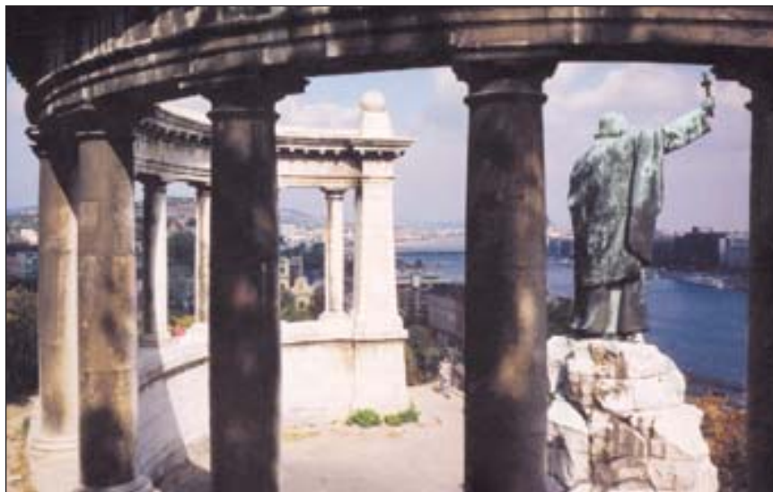
A vértanú Szent Gellért (980-1046) püspök szobra a magyar fővárosban