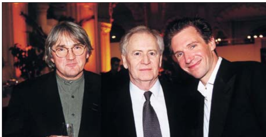
Az Oscar-díjas Szabó István filmrendező mellett Ralph Fiennes Oscar-díjas angol színész és Koltai Lajos operatőr közös filmjük, A napfény íze budapesti bemutatóján

1998-ban pedig a jobbközépen álló Orbán Viktor alakított kormányt. Magyarországon kiépültek a demokratikus jogállam intézményei, az ország 1999-ben a NATO tagja lett, és várhatóan néhány éven belül az Európai Unió tagjává válik.