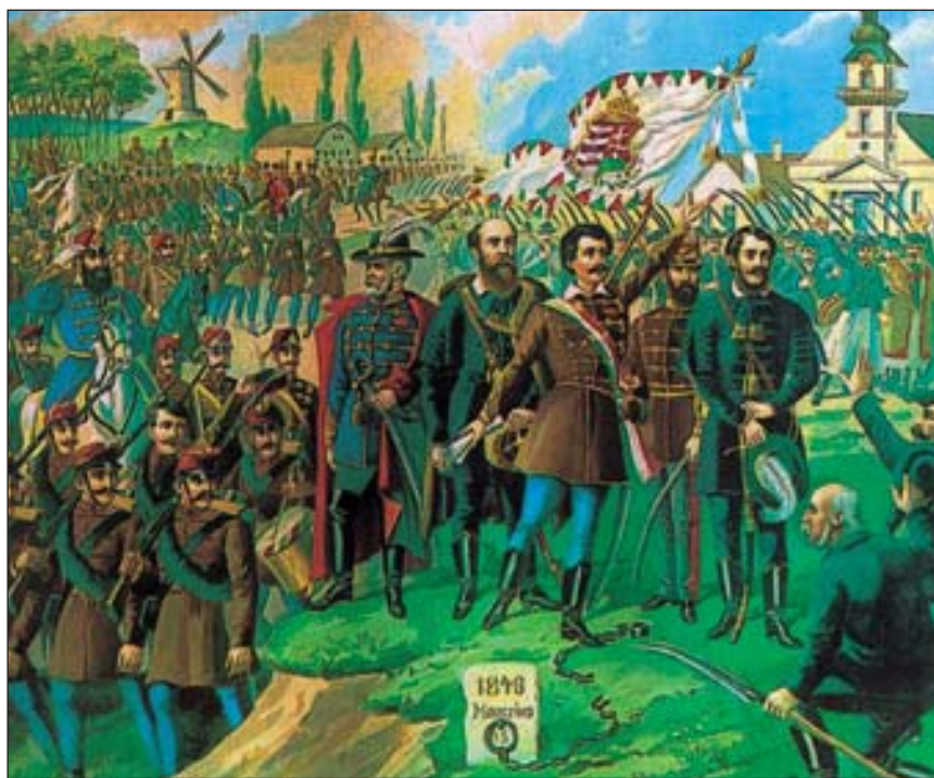
Patetikus hangulatú litográfia az 1848-1849-es Habsburg-ellenes polgári forradalom és szabadságharc vezetőiről. Középen a költő Petőfi Sándor (1823-1849) emeli magasba a kezét

nagyszabású emberi személyiség belső küzdelmeiről adtak vallomást. A fejedelem udvarában élt a magyar próza megújítója is, az urával együtt törökországi száműzetésbe kényszerült Mikos Kelemen.